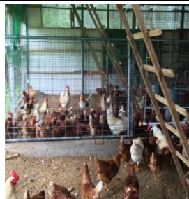
鶏へのストレスを考慮した平飼い鶏舎

全く臭わない平飼いの鶏舎環境で、鶏が本来食する植物由来のオメガ3脂肪酸を多く含む亜麻種子の飼料を与えています。ヘルシー・ファーミング基準(フランスの団体Bleu-Blanc-Coeur国内版基準)ω3、ω6の油脂バランスに特化した家畜の健康指標と畜産物に含まれる脂肪酸バランスの定期分析をおこない人の健康にもつながっています。日常の食から人の健康に。【現在基準外にて定期分析をおこなっています。】